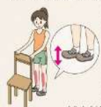
つま先を上げ下げる