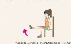
つま先を上に向け、ひざが曲がらないように ゆっくり足を伸ばして5秒保つ