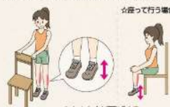
かかとを上げ下げる