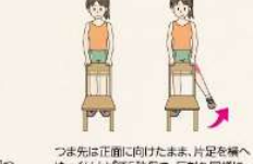
つま先は正面に向けたまま、片足を横へ ゆっくり上げて5秒保つ、反対も同様