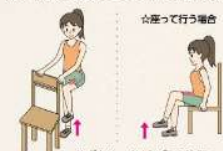
ひざをゆっくり上げて5秒保つ 反対も同様